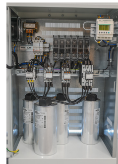
Bateria de condensadores