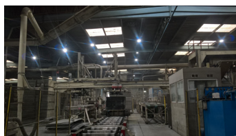
Campânulas Flatbell 200W