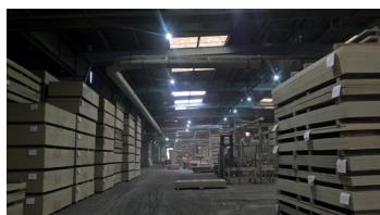
Campânulas Blackbell 100W

"Quando o conforto visual rima com economia de energia"