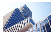
BTE - EDIFÍCIOS DE SERVIÇOS E COMERCIAIS